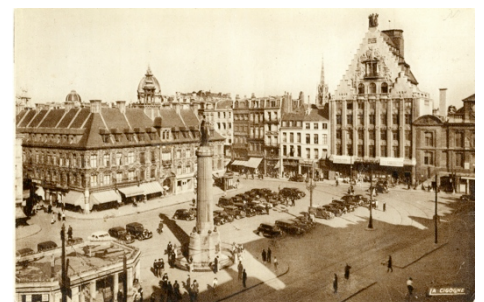
FRAM059350_7Fi839 FRAM059350_7Fi832_1